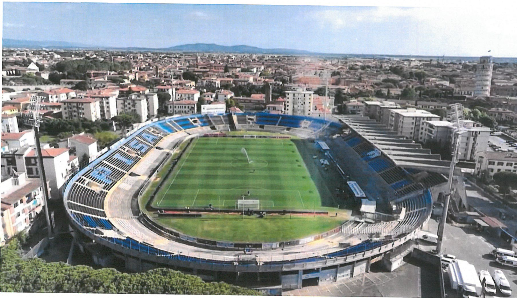
IMMAGINE SKY SPORT